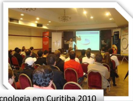
Encontro de Designer e Tecnologia em Curitiba 2010