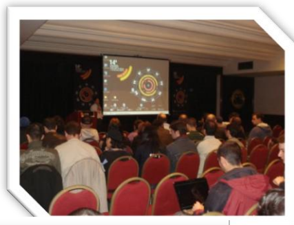
Encontro de Designer e Tecnologia em Curitiba 2012